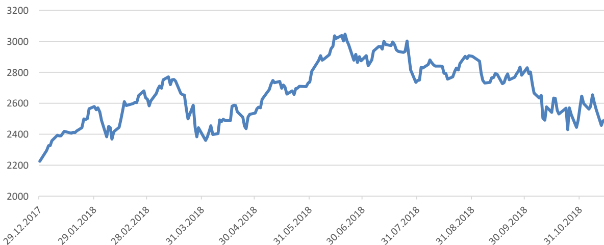
Рисунок 2. Динамика индекса FANG+ (Facebook, Apple, Google, Netflix, Amazon)