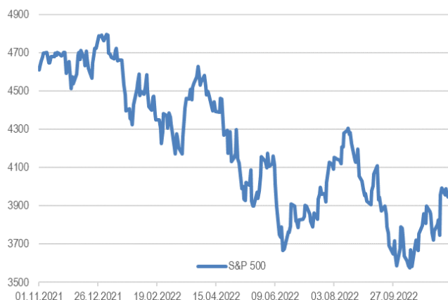
Рисунок 1. Индекс S&P 500