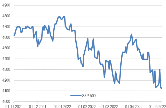
Рисунок 1. Индекс S&P 500